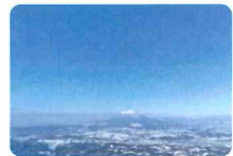
山頂より岩手山(2039m)を望む